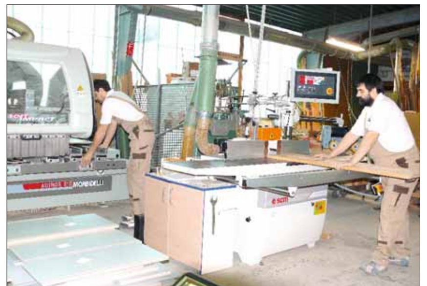
Mit der automatischen Verstellung der fünf Achsen am schwenkbaren Bedienpult sowie der elektronischen Steuerung „Easy“ werden die wichtigsten Maschinenfunktionen schnell und präzise eingestellt.