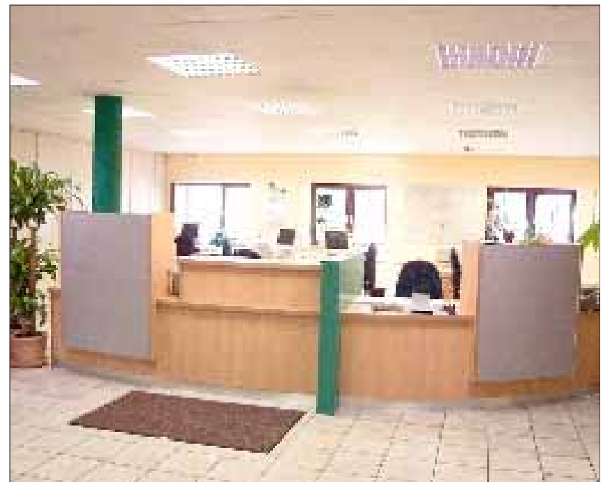
Verkaufsraum einer Genossenschaft mit Empfangsbereich und Schreibtischarbeitsplätzen.