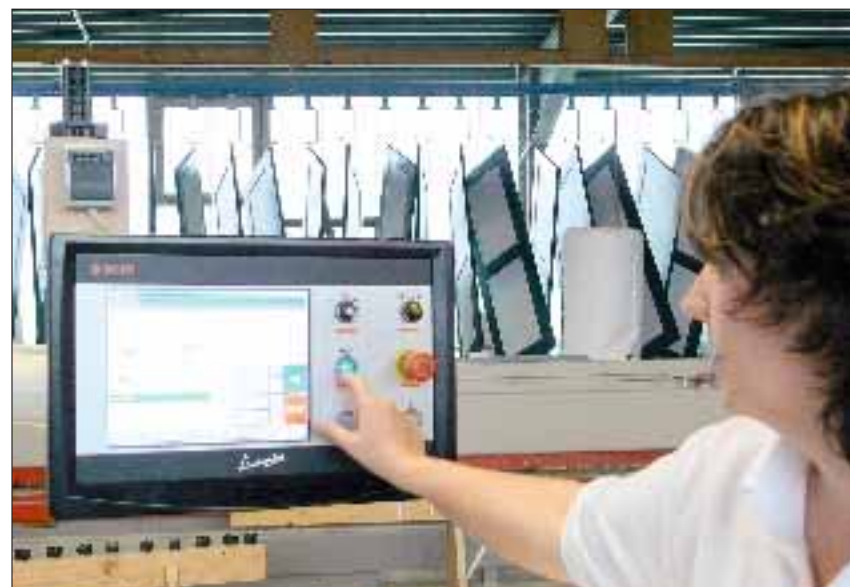
Die gewünschten Schnitt- und Winkelmaße werden nur noch im Dialogfeld eingetippt, das Programm errechnet anschließende alle Längen- und Winkelkorrekturen automatisch.